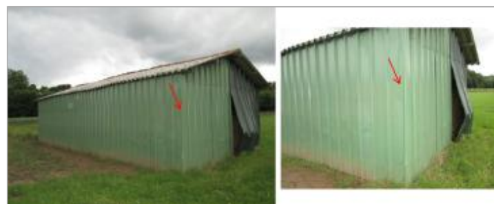
Vue de la laisse - auteur : HYDRATEC

GÉNÉRAL Code : GAD_NIV14_R_m25_1 Date de mise à jour : 13/01/2023 Auteur : SPC GAD