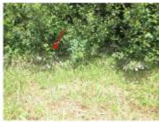
Vue de la laisse - auteur : HYDRATEC