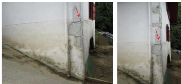
Vue de la laisse - auteur : HYDRATEC