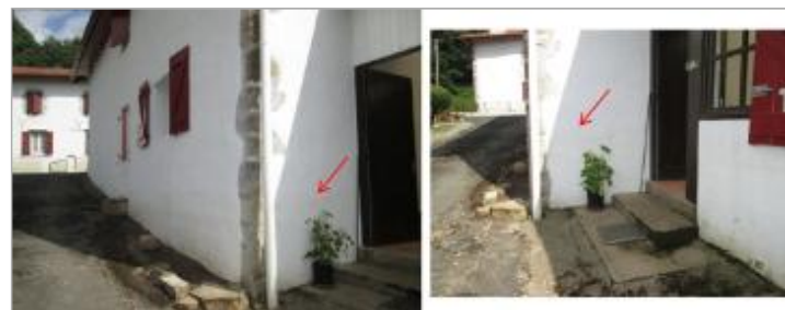
Vue de la laisse - auteur : HYDRATEC

GÉNÉRAL Code : GAD_NIV14_R_m09_1 Date de mise à jour : 13/01/2023 Auteur : SPC GAD