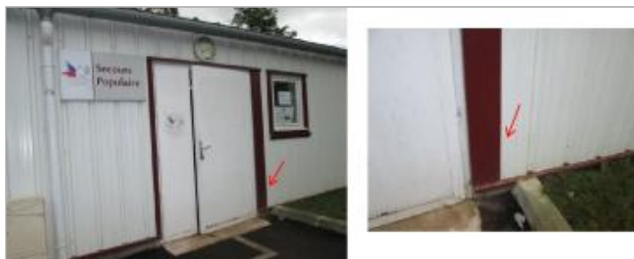
Vue de la laisse - auteur : HYDRATEC

SOURCE DE REPÉRAGE : RELEVÉ DE LAISSES DE LA CRUE DE JUILLET 2014 SUR LA NIVE - 06/07/2015