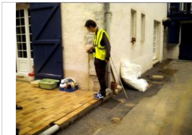
Vue de la laisse - auteur : ARTELIA

Altitude calculée de l'eau (en m) : 5.635 m