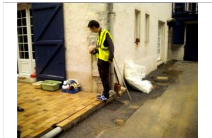
Vue de la laisse - auteur : ARTELIA