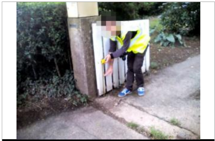
Vue de la laisse - auteur : ARTELIA

GÉNÉRAL Code : GAD_NIV14_R_av22_1 Date de mise à jour : 13/01/2023 Auteur : SPC GAD