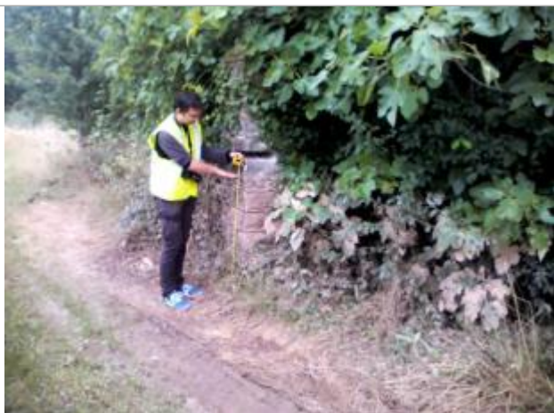
Vue de la laisse - auteur : ARTELIA

Altitude calculée de l'eau (en m) : 4.051 m