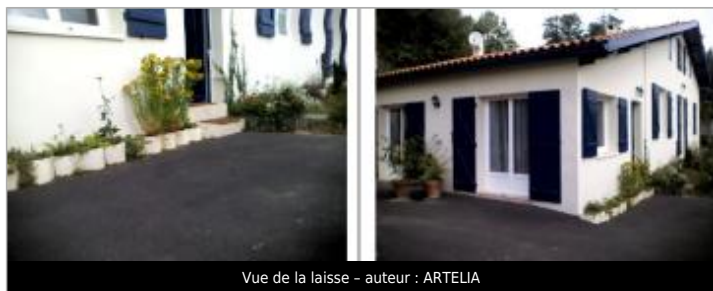
Vue de la laisse - auteur : ARTELIA