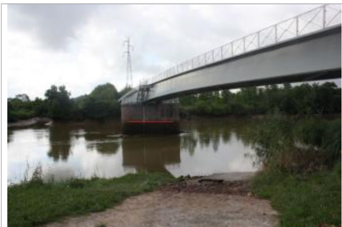
Vue de la laisse - auteur : ARTELIA

Altitude calculée de l'eau (en m) : 2.281 m