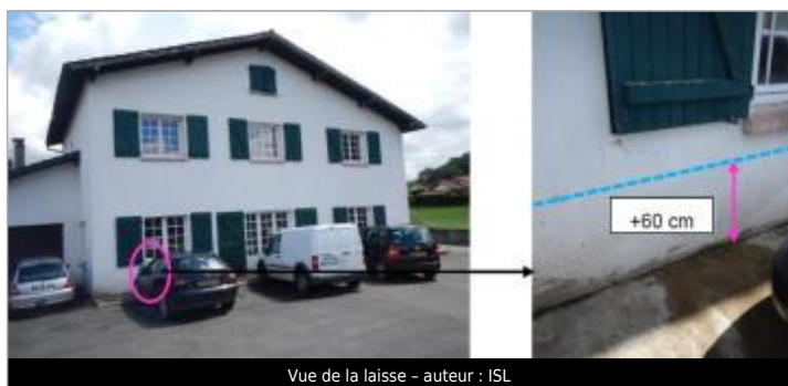
Vue de la laisse - auteur : ISL