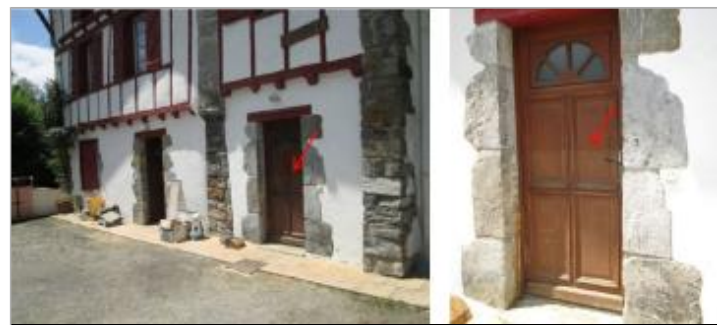
Vue de la laisse - auteur : HYDRATEC

GÉNÉRAL Code : GAD_NIV14_R_m48_1 Date de mise à jour : 13/01/2023 Auteur : SPC GAD