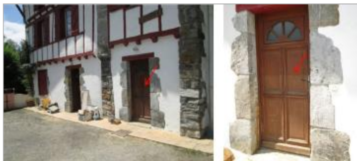
Vue de la laisse - auteur : HYDRATEC