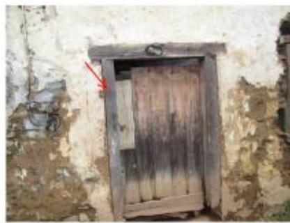
Vue de la laisse - auteur : HYDRATEC