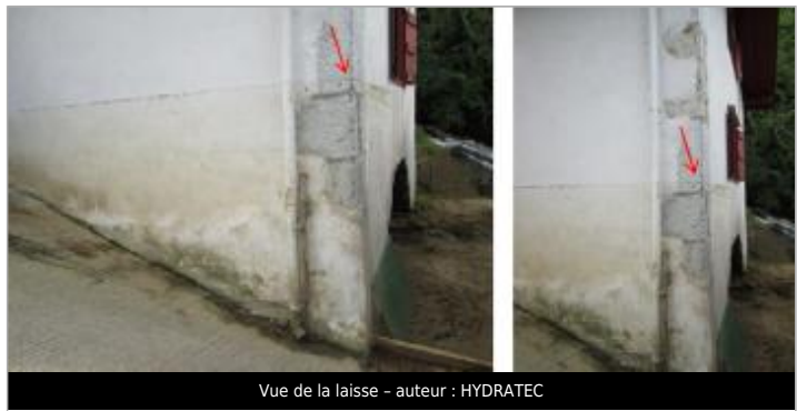
Vue de la laisse - auteur : HYDRATEC

GÉNÉRAL Code : GAD_NIV14_R_m20_1 Date de mise à jour : 13/01/2023 Auteur : SPC GAD