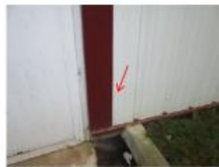
Vue de la laisse - auteur : HYDRATEC