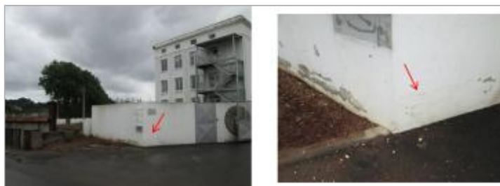
Vue de la laisse - auteur : HYDRATEC