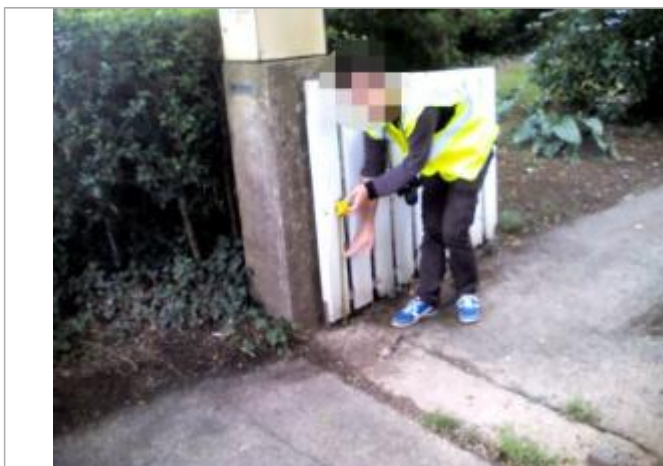
Vue de la laisse - auteur : ARTELIA

Altitude calculée de l'eau (en m) : 4.13