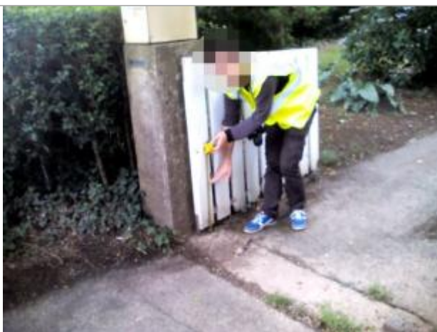
Vue de la laisse - auteur : ARTELIA

Altitude calculée de l'eau (en m) : 4.13