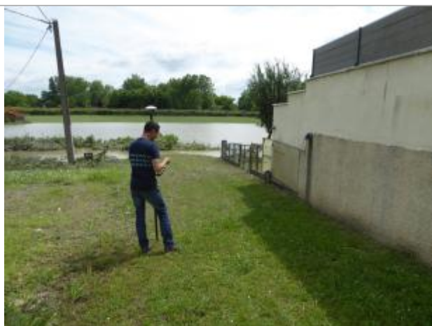
Vue de la laisse - auteur : SPC GAD