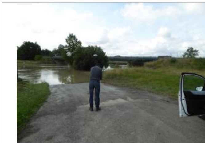
Vue de la laisse - auteur : SPC GAD