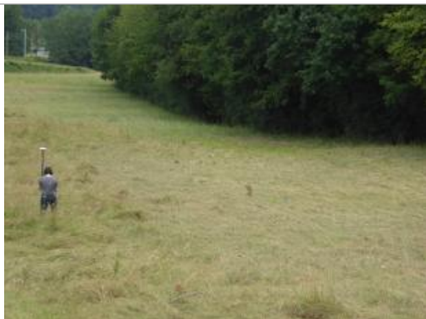
Vue de la laisse - auteur : SPC GAD