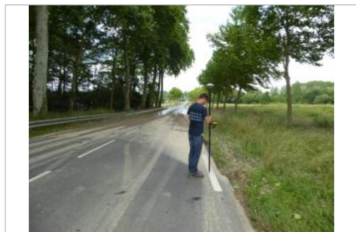
Vue de la laïsse

GÉNÉRAL Code : GAD_JUIN18_R_gr32_1 Date de mise à jour : 13/01/2023 Auteur : SPC GAD