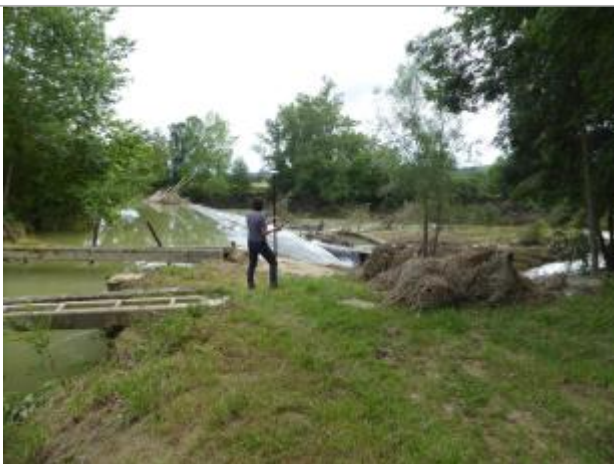
Vue de la laisse - auteur : SPC GAD

Altitude calculée de l'eau (en m) : 175.584