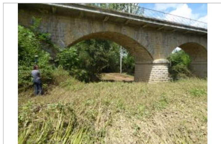
Vue de la laïsse - auteur : SPC GAD

GÉNÉRAL Code : GAD_JUIN18_R_aam16_1 Date de mise à jour : 13/01/2023 Auteur : SPC GAD