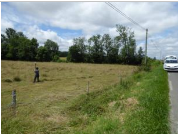
Vue de la laisse - auteur : SPC GAD

Altitude calculée de l'eau (en m) : 232.353