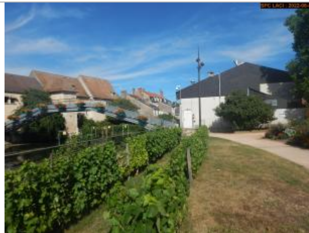
Vue du site éloignée