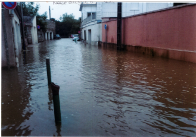
mesure au niveau du poteau