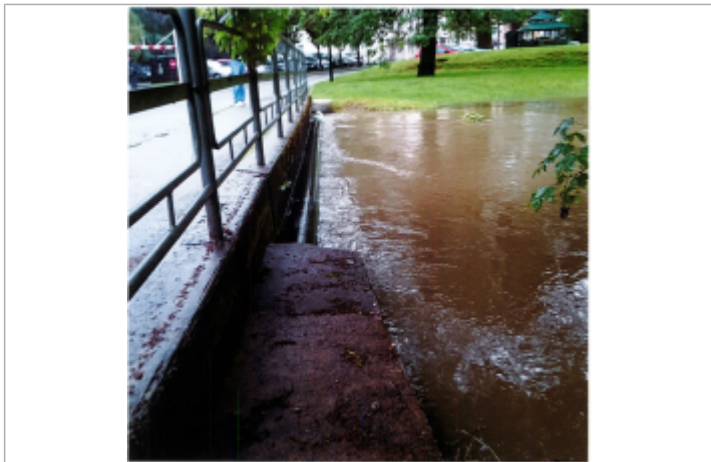
pont entre la rue du Moulin et la rue de la corderie, eau jusqu'au pont