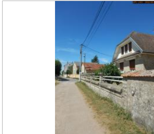
Vue du site éloignée (vers l'aval)