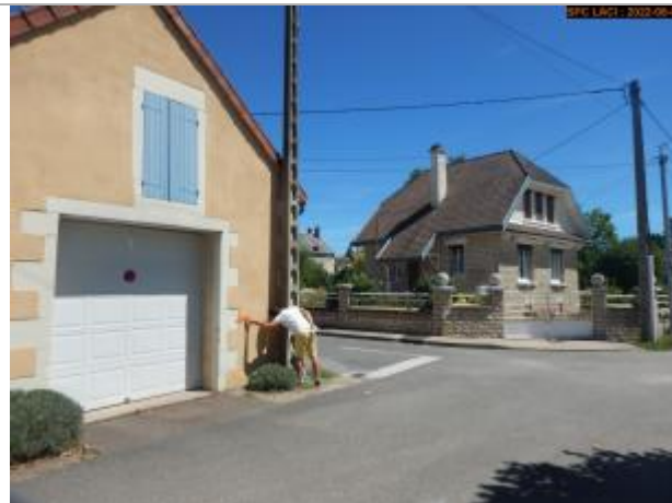
Vue du site éloignée (montant de la porte garage)

Coordonnées WGS84 : X: 2.95963607 / Y: 47.27882634