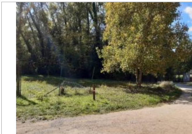
Site de Saint-Martin-de-Castillon - Station de pompage de la Bégude