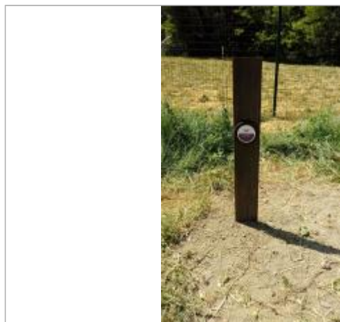
Repère de crue 2008 - Poteau en fer côté route/parking