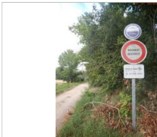
Vue du repère éloignée