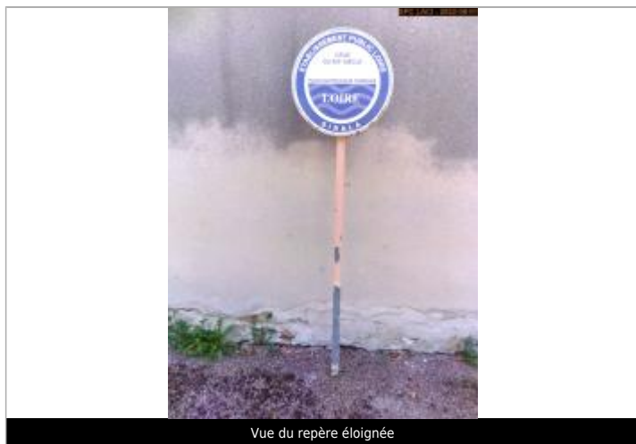
Vue du repère éloignée

SOURCE DE REPÉRAGE : SPC LACI, CAMPAGNE DE RECENSEMENT 2022 -