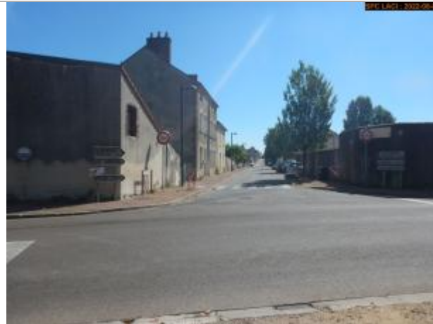
Vue du site éloignée