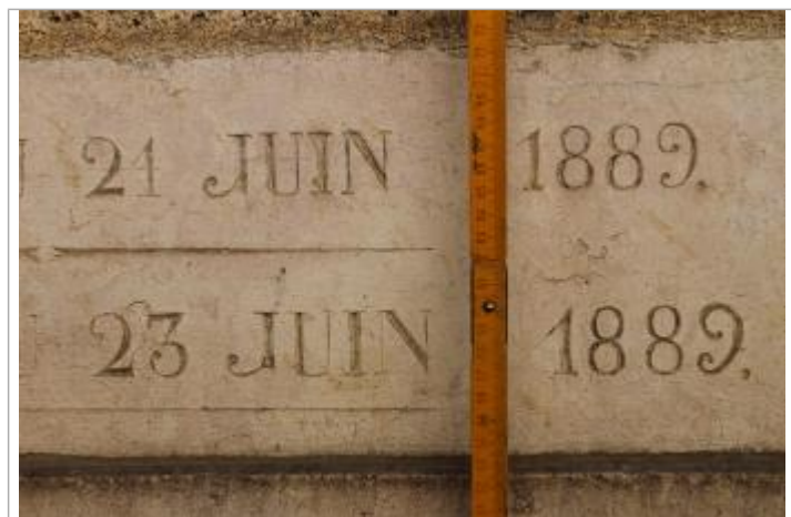
marque à 55cm du sol