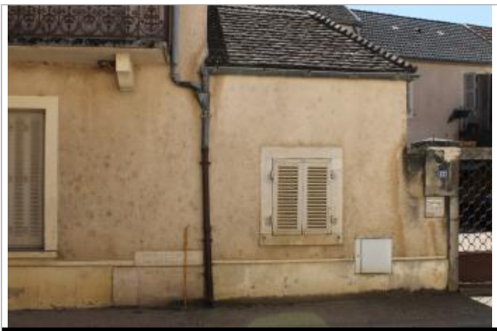
au pied de la façade sur la rue, à gauche de la descente de gouttière

GÉOLOCALISATION Coordonnées WGS84 : X: 4.79404299 / Y: 47.01030980 Coordonnées RGF93 (Lambert 93) X: 836285.3 / Y: 6658224.25 Coordonnées RGF93 (ETRS89) : X: 4.794043 / Y: 47.0103098 Code Hydro : Q0000630 Rive de référence :