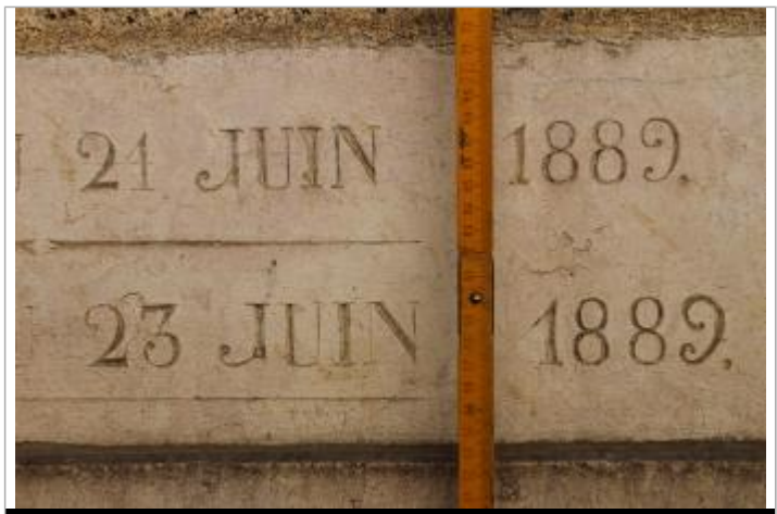
marque à 55cm du sol

MARQUE Texte : crue d'eau du 23 juin 1889 Visibilité : Oui État du repère : Bon Pérennité : Longue