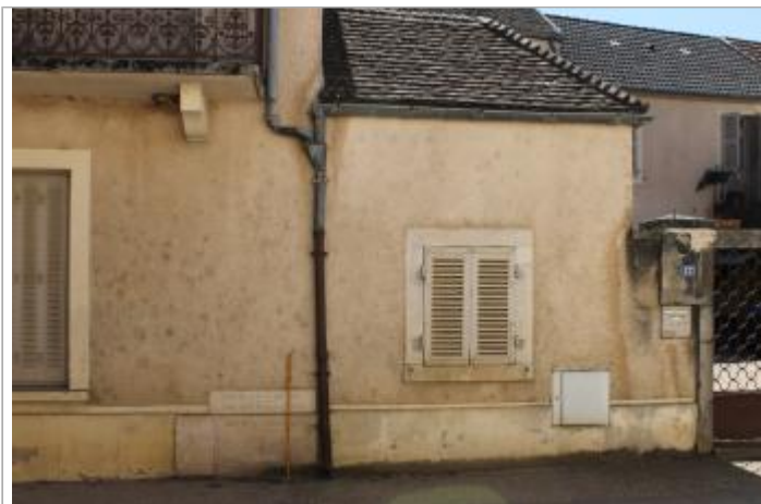
au pied de la façade sur la rue, à gauche de la descente de gouttière