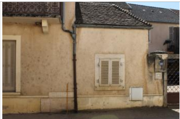
au pied de la façade sur la rue, à gauche de la descente de gouttière