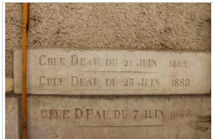
marque a 62cm du sol