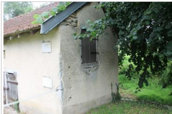
angle sud-ouest du bâtiment