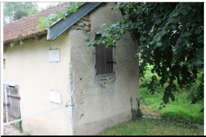
angle sud-ouest du bâtiment

GÉOLOCALISATION Coordonnées WGS84 : X: 4.88005587 / Y: 47.16303820 Coordonnées RGF93 (Lambert 93) X: 842414.23 / Y: 6675335.38 Coordonnées RGF93 (ETRS89) : X: 4.8800559 / Y: 47.1630382 Code Hydro: Q0000630 Rive de référence: Droite