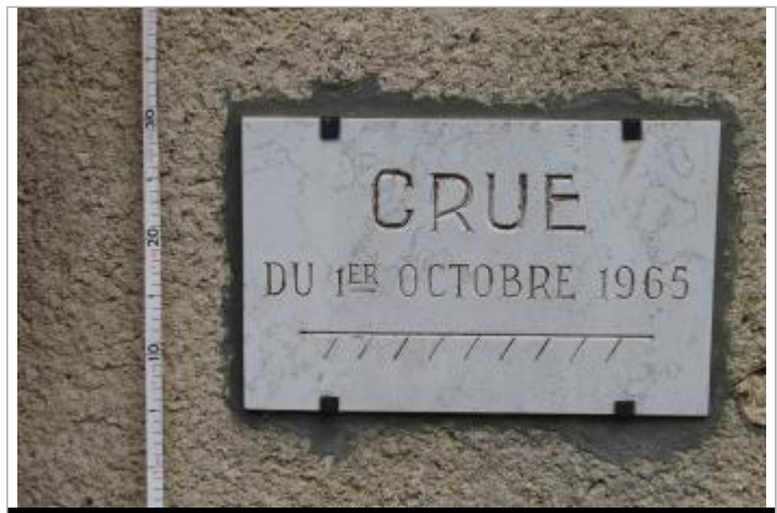
plaque en pierre gravée à 11cm du sol

MARQUE Texte : crue du 1er octobre 1965 Maximum de l'inondation : Oui Visibilité : Oui État du repère : Bon Pérennité : Longue