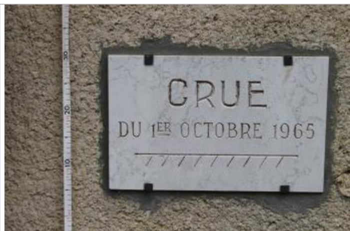
plaque en pierre gravée à 11cm du sol