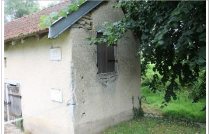
angle sud-ouest du bâtiment