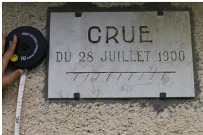
plaque en pierre gravée à 2m du sol