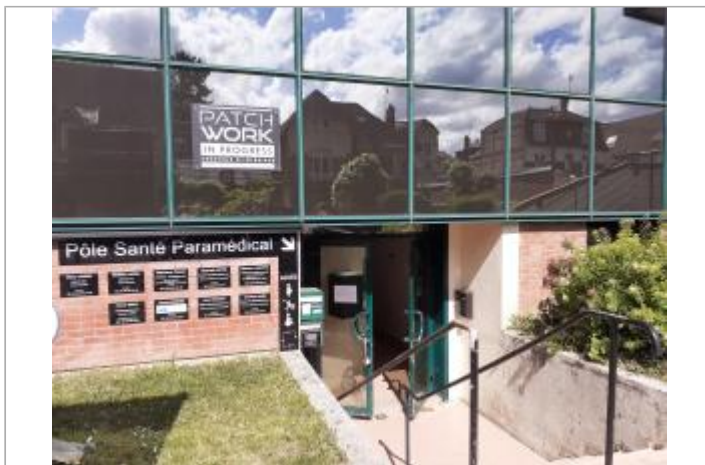
hall d'accès du cabinet médical