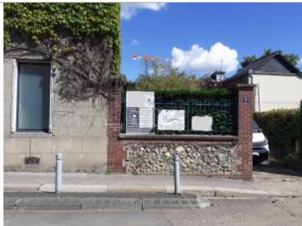
laisse de végétation sur grille d'aération cave