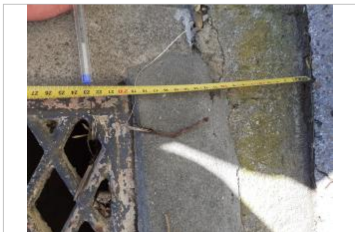
Trace de végétation dans la grille d'aération à 23 cm du sol

Maximum de l'inondation : Oui Visibilité : Oui État du repère : Bon Pérennité : Longue