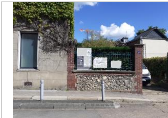
laisse de végétation sur grille d'aération cave