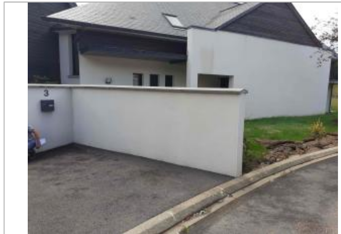
Axe de ruissellement sur l'allée du Cheval Blanc

Coordonnées WGS84 : X: 1.09161578 / Y: 49.46849480