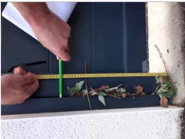
trace de végétation sur portail piéton à 40 cm de hauteur de la margelle