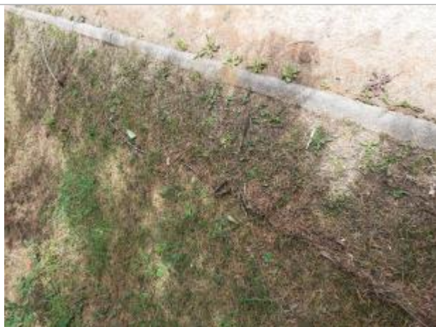
axe de ruissellement sur la route de Maromme matérialisé par laisse de végétation sur bande enherbée