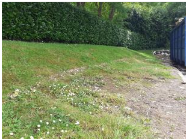
Laisse de végétation sur la pelouse

Type de repérage : Campagne de terrain post-inondation Organisme(s) : DDTM 76