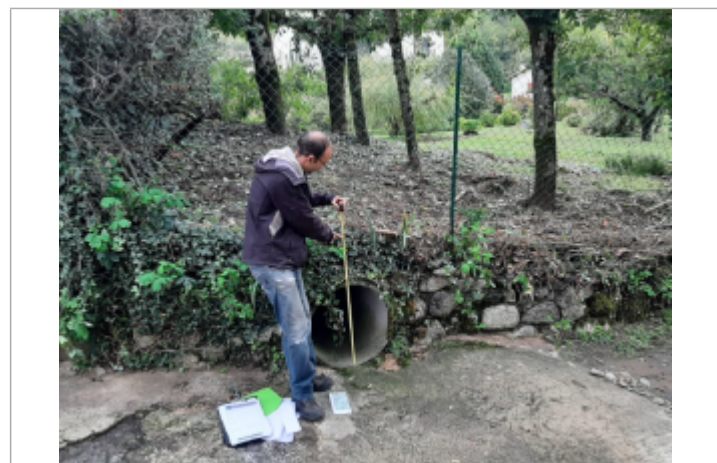
laisse de crue sur le grillage

GÉNÉRAL Code : WEB_R_202212210104 Date de mise à jour : 21/12/2022 Auteur : SPC GD