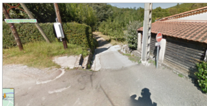
Route du stade - chemin d'accès pour l'AEP

GÉOLOCALISATION Coordonnées WGS84 : X: 3.96725791 / Y: 44.30752650 Coordonnées RGF93 (Lambert 93) X: 777159.61 / Y: 6356972.84 Coordonnées RGF93 (ETRS89) : X: 3.9672579 / Y: 44.3075265 Code Hydro: Q0000630 Rive de référence: Droite