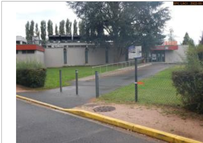
Vue du site éloignée