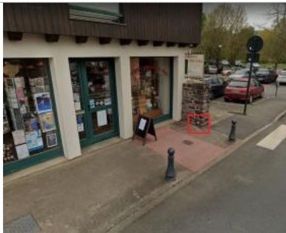
muret au 6 rue des arcades en 2022