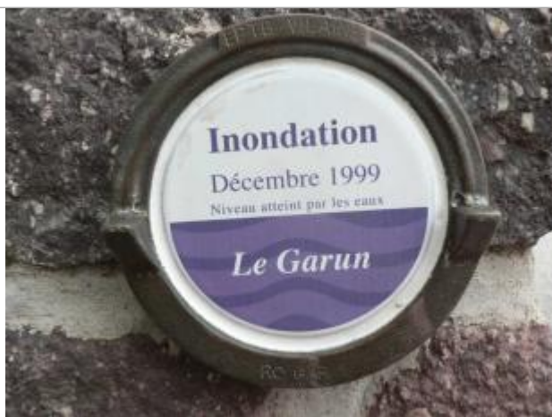
Repère normalisé de l'inondation de décembre 1999

Altitude calculée de l'eau (en m) : 34.93 m