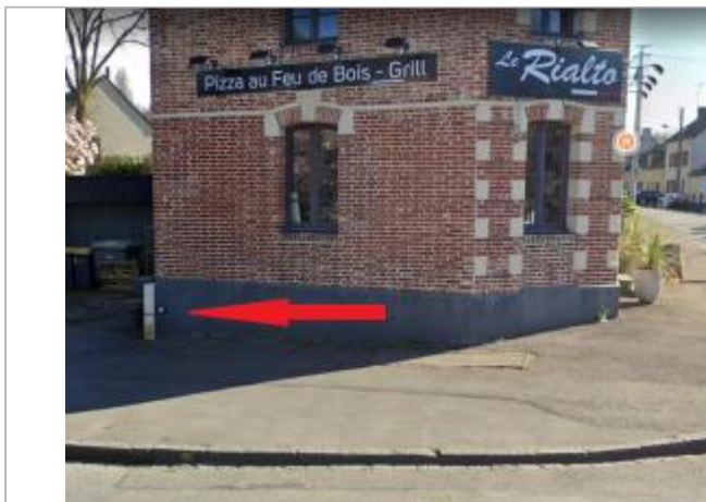
Pignon d'un bâtiment - restaurant en 2022