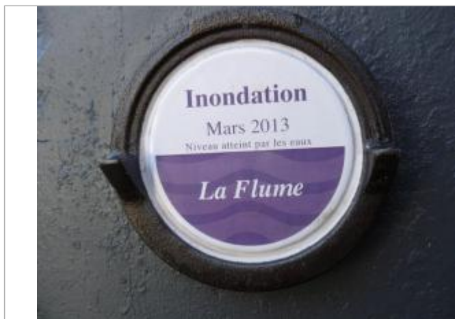
Repère normalisé de l'inondation de mars 2013