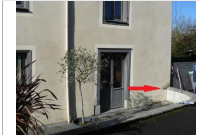
Bâtiment au 18 rue du Dct Léon en 2017

Coordonnées WGS84 : X: -1.78827004 / Y: 48.14881420