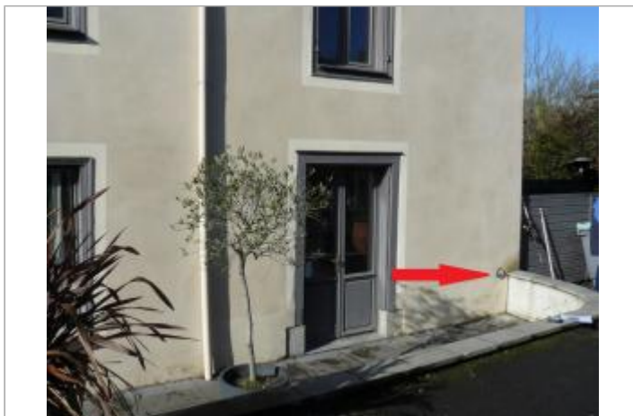
Bâtiment au 18 rue du Dct Léon en 2017