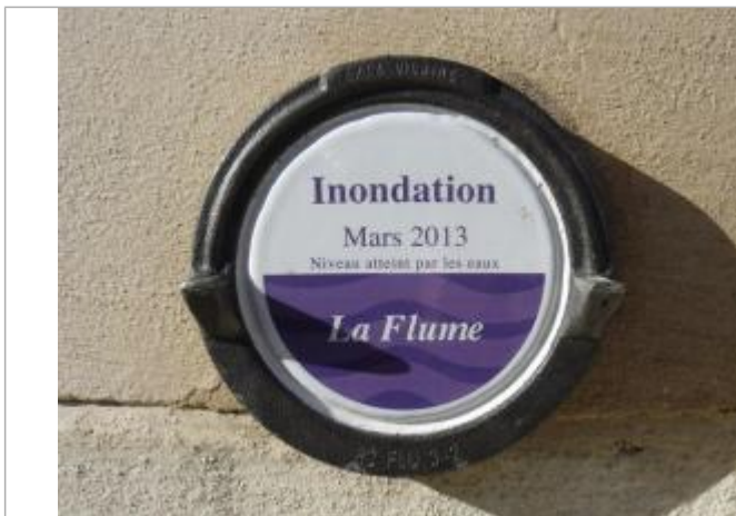
Repère normalisé de l'inondation de mars 2013

Altitude calculée de l'eau (en m) : 34.58 m