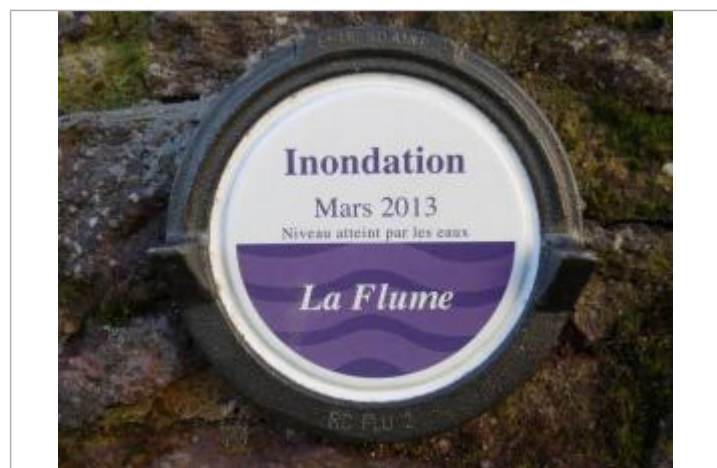
Repère normalisé de l'inondation de mars 2013