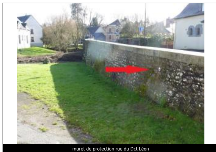
muret de protection rue du Dct Léon