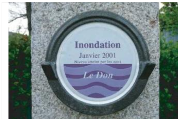
Repère normalisé de l'inondation de janvier 2001

Altitude calculée de l'eau (en m) : 6.5 m