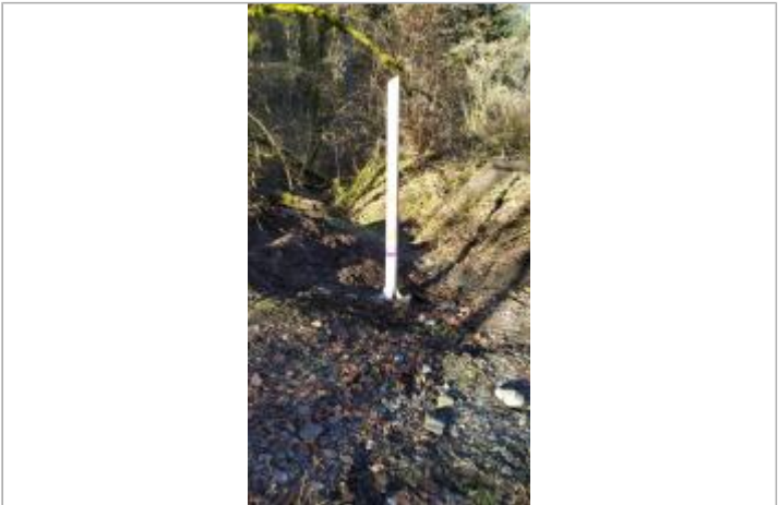
Hameau de Bois Dessous