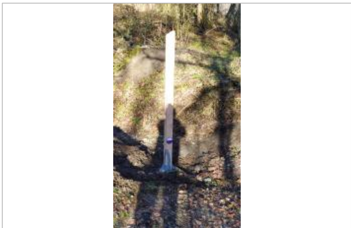
Hameau des Bois