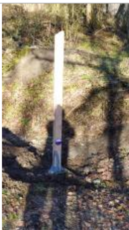
Hameau des Bois