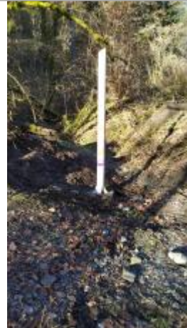
Hameau de Bois Dessous